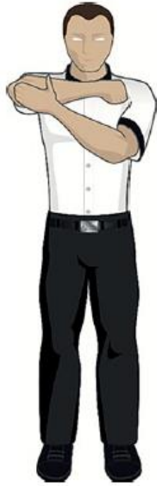
Frapper avec le coude