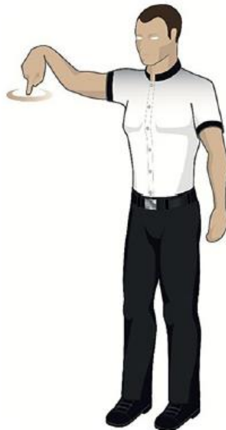
Ne pas faire de demi-tour