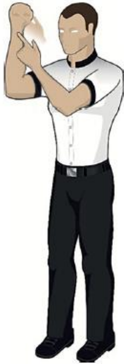
Frapper avec la main ouverte