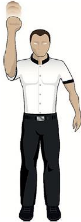
Frotter le gant au visage