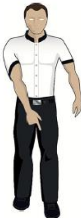
Marcher sur le pied de l'adversaire