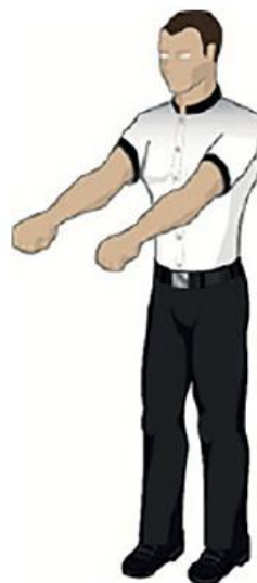
Faire essayer les gants