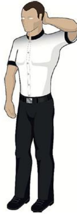
Frapper derrière la tête