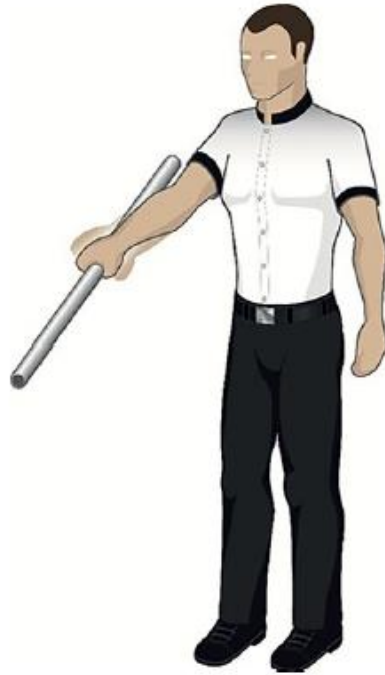
Usage illégale des cordes