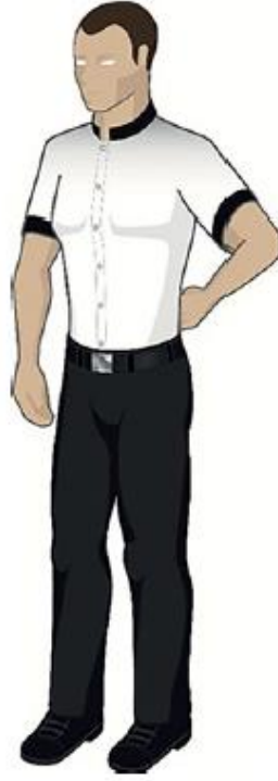
Frapper dans le dos