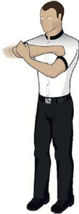
Pousser avec l'avant-bras