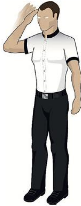
Coup de tête