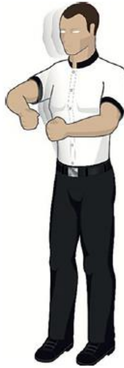
Se laisser tomber sur l'adversaire