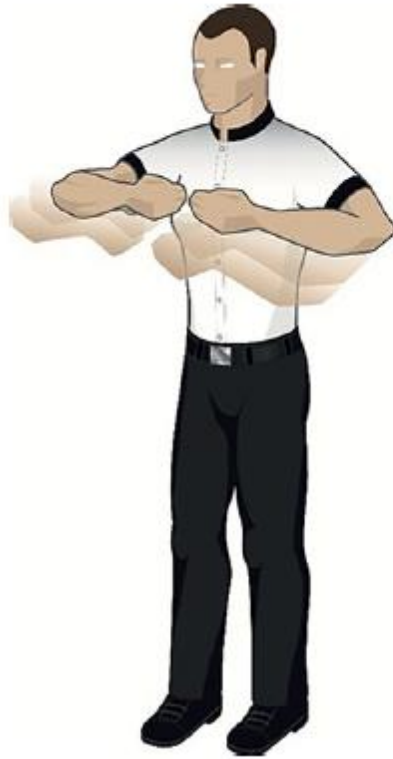
Tirer l'adversaire vers soi