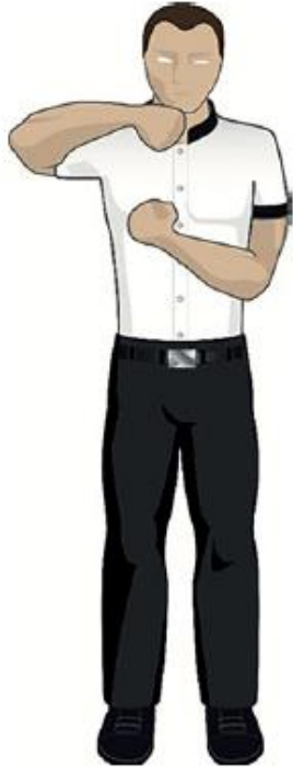
Retenir et frapper