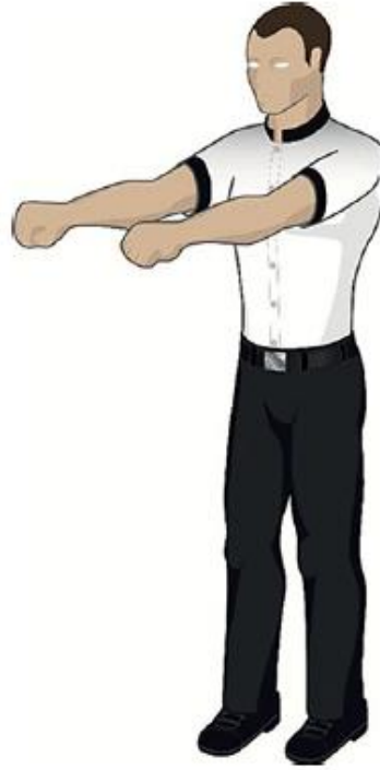
Entrer au corps à corps avec les bras tendus