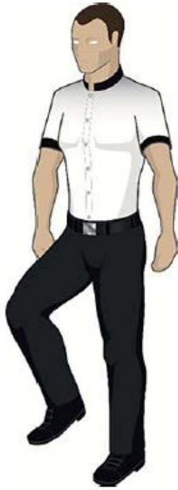
Frapper avec le genou