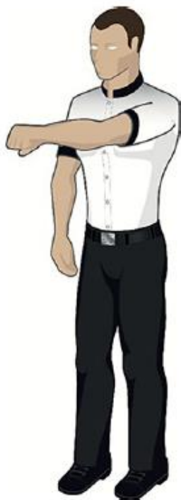
Garder le bras tendu vers l'adversaire